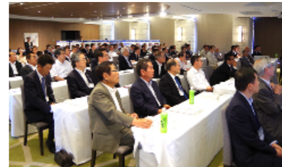
講演に聴き入る出席者の皆さん