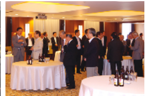
圧入の未来を忌憚なく語り合いました